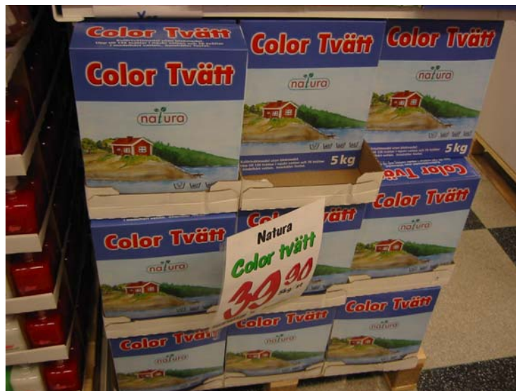
Natura, ännu ett icke miljömärkt tvättmedel.