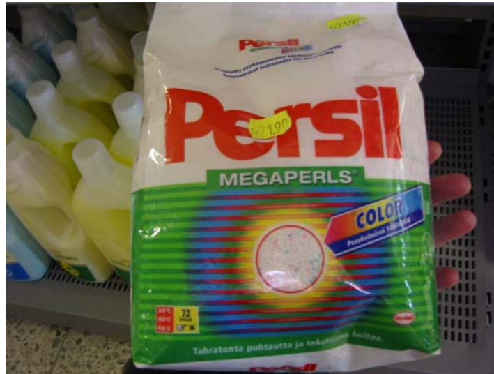
Percil Megapearls, tvättmedlet med 28 % L.A.S.