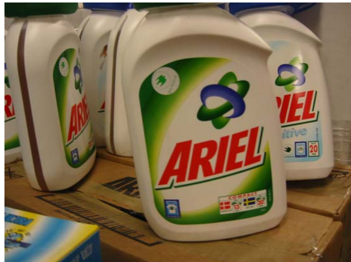
Ariel med påklitrade Bra miljöval märken på.