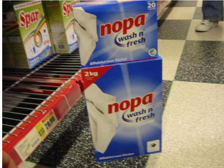
Nopa 1kg med Svanen märkning och Nopa 2kg med Bra miljövals märkning.