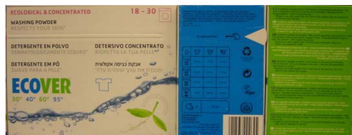
Ecover, ett påstått ekologiskt tvättmedel utan miljömärke?